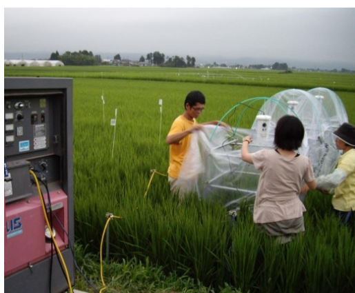
図2. ケイ酸資材施用下での水稻の高温障害試験

現在、土壌肥よく度部門で発表される研究の多くは問題解決型研究ですが、これらと関連した掘り下げ型研究も活発に行っています。かつて実施された長期連用試験の解析に基づく有機物施用の理論化は、近年、田畑輪換における地力低下要因の解析と土壌管理に関する研究へと進展をみせています。また、水田へのケイ酸資材施用や水田における中干し効果に関する研究も注目されます。