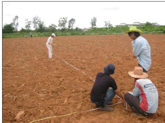
図3. タイにおける圃場試験

おいては肥料・土壌改良資材部門等の研究者との共同研究も必要です。これら関連部門間の連携はますます重要になってきているため、2010年度北海道大会では、関連部門が共催して「土壌診断の現状と今後への挑戦—流派そろい踏み」と題したシンポジウムを企画しました。このような機会を通じて部門の異なる研究者相互のコラボレーションを図っていくことは土壌肥よく度部門の研究のさらなる活性化にもつながるものと考えています。