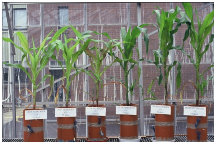
図4. 作物の生育と土壌根圏環境のモニタリング