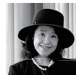
山口しのぶ 日本学術会議連携会員、東京工業大学 名誉教授