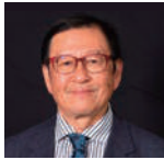
高田研 一般社団法人地球温暖化防止全国ネットワーク 理事長