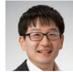
近藤康久 日本学術会議連携会員、総合地球環境学研究所 教授