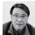
河野哲也 日本学術会議第一部会員、立教大学 教授