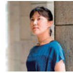
浅利美鈴 日本学術会議連携会員、総合地球環境学研究所 教授