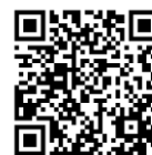
伊予鉄松山観光港リムジンバス時刻表

https://www.iyotetsu.co.jp/bus/limousine/airport/