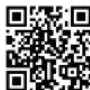
伊予鉄空港リムジンバス時刻表

https://www.iyotetsu.co.jp/bus/limousine/airport/